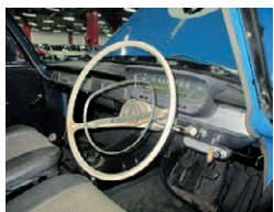
インテリアはノーマルの様子だが、実際のレース仕様へどこまで近づけるか

再生クラブがレストアしたS54 A1型モプリンスグロリアスーパー6が共に鈴鹿で走る姿が見られるかもしれない。再生クラブによって当時の姿が見られることを期待したい。