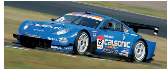
2006年のSUPER GT GT500クラスでTEAM IMPULからエントリーし、カルソニック インパルZ (Z33型) を操り見事勝利