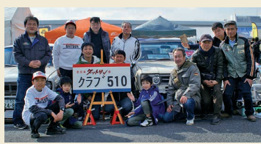
様々なイベントなどでブルーバードファンとお目にかかれるのを楽しみにしています！

仲間と共にこれからもブルーバードを愉しんでいきたい」トサンは共通部品が多いのでと話してくれた。さらに「クラブS30さんとはクラブ同士のツーリングを企画したこともあるんですよ」と車種を超えたつながりも紹介してくれた。「これまでと同様、動態保存に向けて一台でも多くの510を後世に残すことを目的に活動をしていきたいと思いますが、特に経済的な理由で旧車を楽しむことに躊躇している方には、自身で簡単なメンテナンスが出来るノウハウをお伝えするなどして、少しでも経済的負担を軽くして、長くブルー