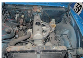
日本で初めて100馬力を突破したG7型エンジン

に、本誌編集長でもある日置和夫から「完成が前倒してきたら11月に鈴鹿サーキットで走らせてみては?」との提案があり、会場は日本グランプリ開催当時の再現を期待した大きな拍手が沸き起こった。再生クラブが手掛けた車両は例年12月に開催されるニスモフェスティバルでお披露目されることが多いが、今年は少し早いお披露目が叶うかもしれない。