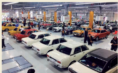
2017年4月に510車発売50周年記念イベントを埼玉県・鴻巣市の関東工大自動車大学校にてクラブ510主催で開催

ブルーバードを楽しめる環境をお伝えたいです」と、クラブのこれからについて語ってくれた。こうしたクラブがあり、ファンが続ける限り、ブルーバードはこれからも日産、そして日本を代表する愛されるクルマの一台としてあり続けることだろう。