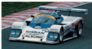
星野選手のレース人生においても深く関わることになるグループC。写真は1987年の「NISSAN R87E」

無敵を誇ったR32 型GT-R。「カルソニック・スカイライン」は星野選手の代名詞に