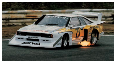
当時の若者を虜にしたスーパーシルエット「シルビアターボ」