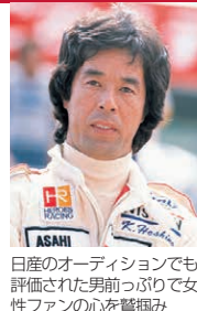
日産のオーディションでも評価された男前っぷりで女性ファンの心を鷲掴み